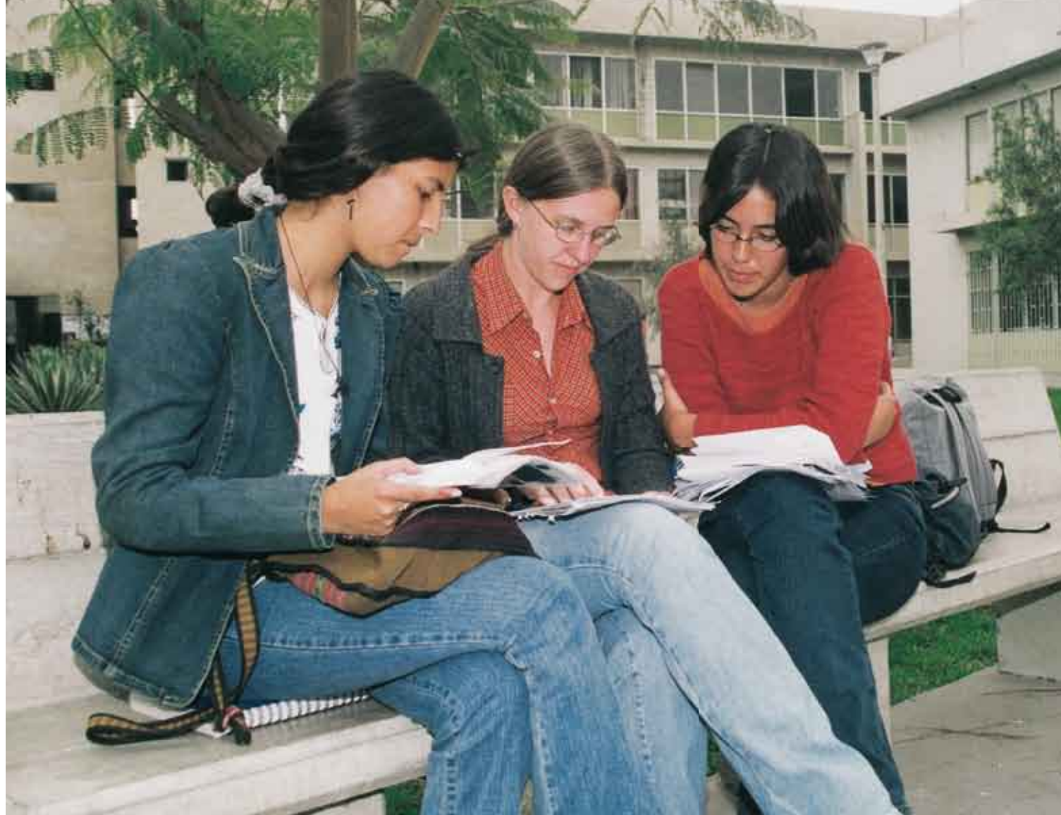
Universidades peruanas aparecen en los últimos lugares en los ranking mundiales, por ello es necesario mejorar la calidad educativa.

- La demanda de acceso al sistema universitario es marcadamente asimétrica, en el sentido de que sobre 129 carreras, las 20 más demandadas concentran al