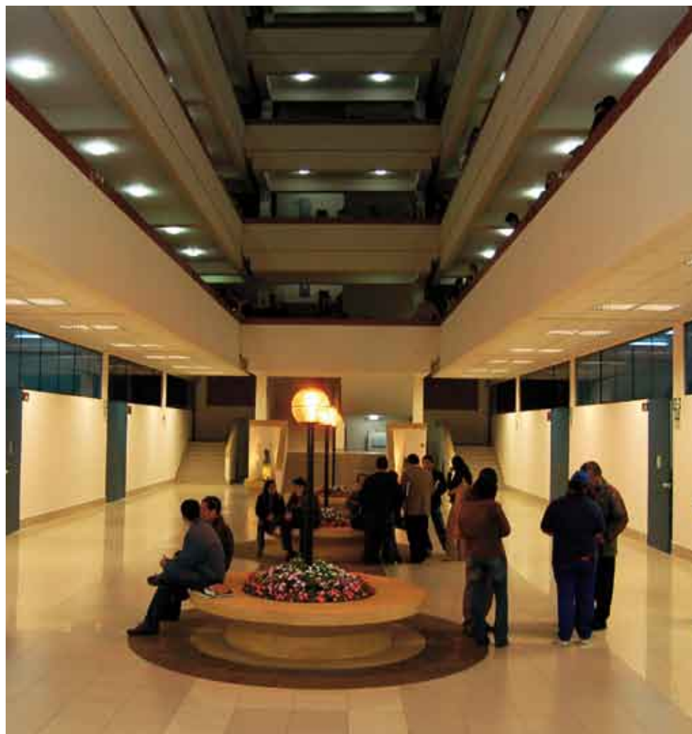
Universidad Inca Garcilaso de la Vega contribuye, con ideas y sugerencias de sus profesores y alumnos, a mejorar niveles académicos.

Desde sus aulas contribuye a la solución de problemas nacionales