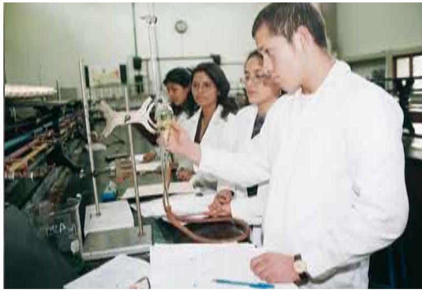
Invertir recursos para implementar tecnología en las universidades, es una de las prioridades que se debe atender.

A través de un modelo académico inspirado en una interacción dinámica entre ciencia, tecnología y cultura