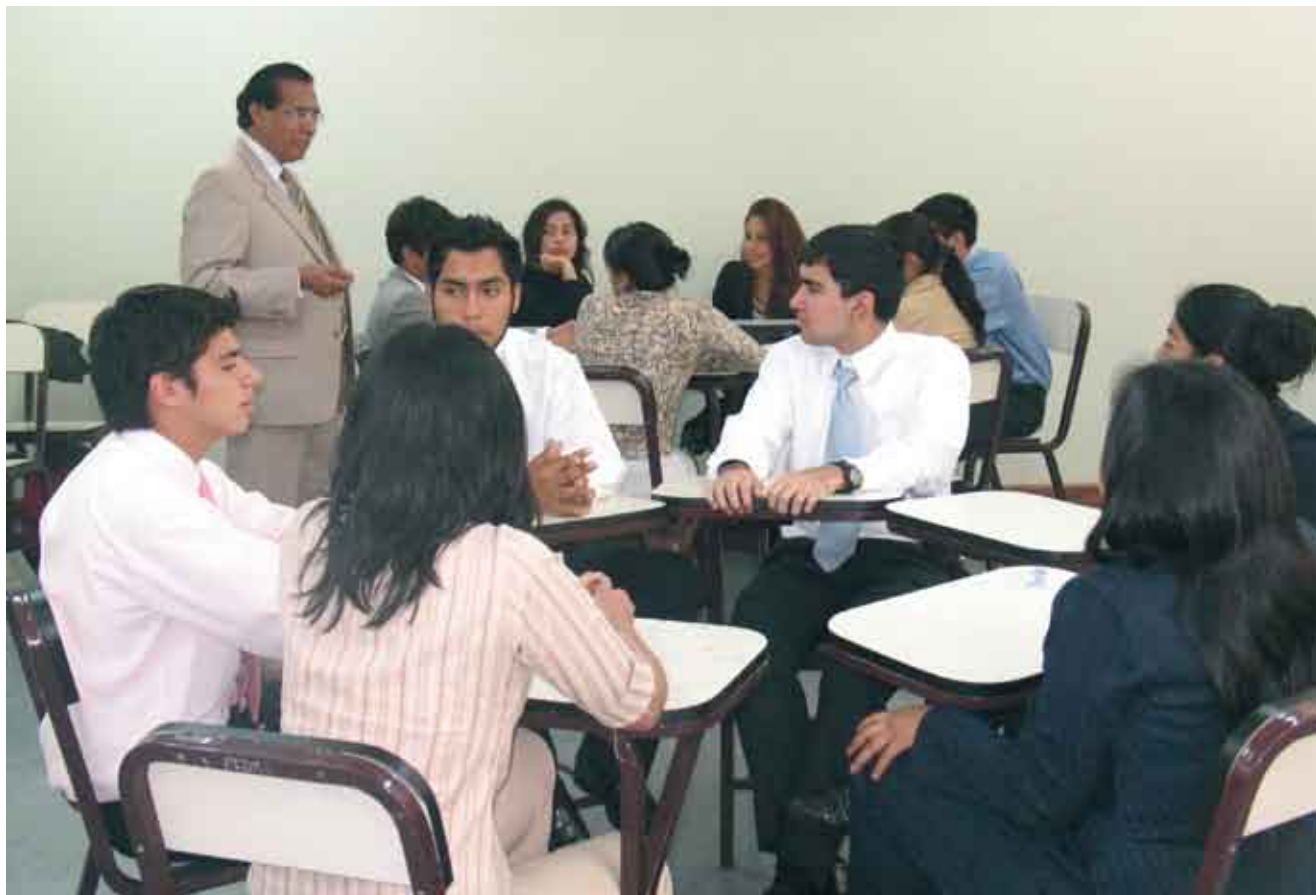
Alumnos universitarios deben ser proactivos y desarrollar sus capacidades.