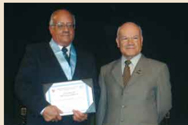
Francisco Delgado de la Flor, presidente del Consejo Nacional de la Magistratura por su importante contribución al fortalecimiento de la imagen de la universidad peruana.