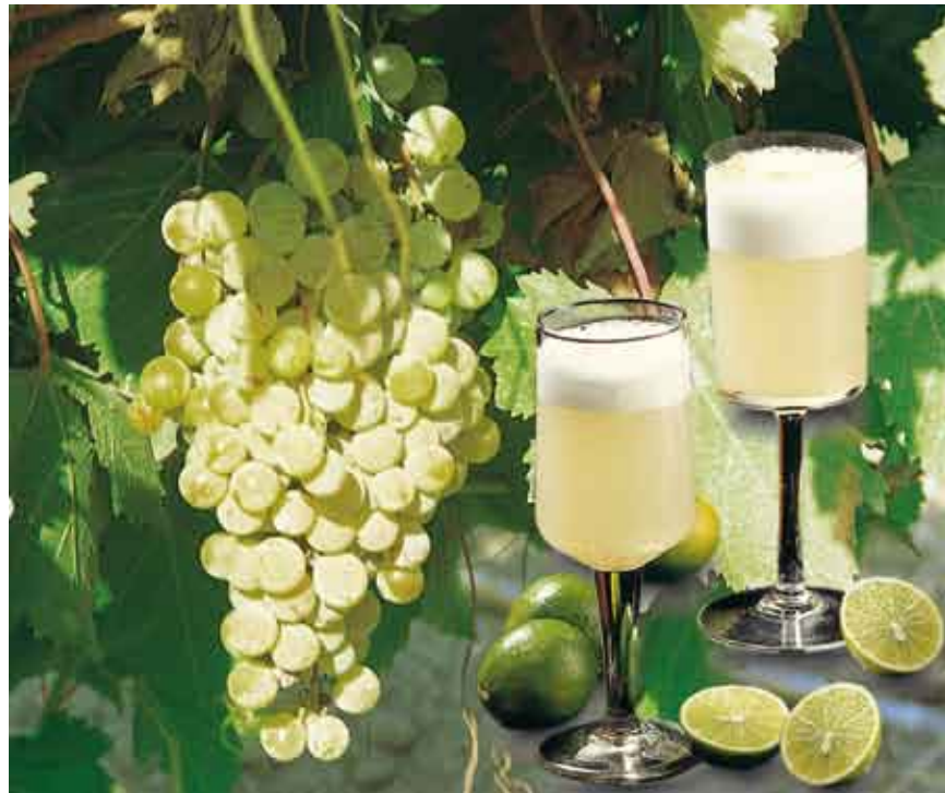
El Pisco es nuestro producto de bandera y es peruano, porque sirvió para designar al puerto y al pueblo del mismo nombre, ubicados en el actual departamento de Ica.

Av. Revolución s/n, Sector 3, Grupo 10, Mz. "M" Lt. 17 - Villa el Salvador Teléfonos : 493-2727 / 260-5075 www.untecs.edu.pe