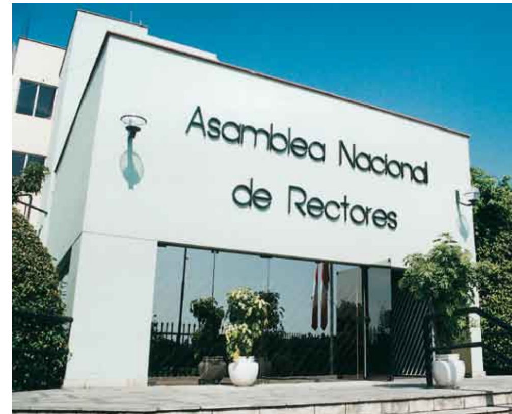
Coordinación de la Asamblea Nacional de Rectores es importante.

No solo de leyes sino también de actitudes. Tiene que mejorarse los presupuestos de las universidades, y a través de ello levantar la calidad de servicios implicando todo lo demás como la mejora en la remuneración de los docentes. Además, tiene que equiparse a los centros de estudio de laboratorios, de bibliotecas. Eso tiene que hacerse de manera extraordinaria y urgente para crear las