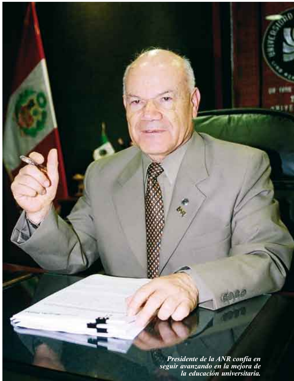
Presidente de la ANR confía en seguir avanzando en la mejora de la educación universitaria.

Intensificar todo lo anteriormente mencionado, además de la biblioteca de la ANR que debe tener la mejor documentación de universidades. Intensificar las