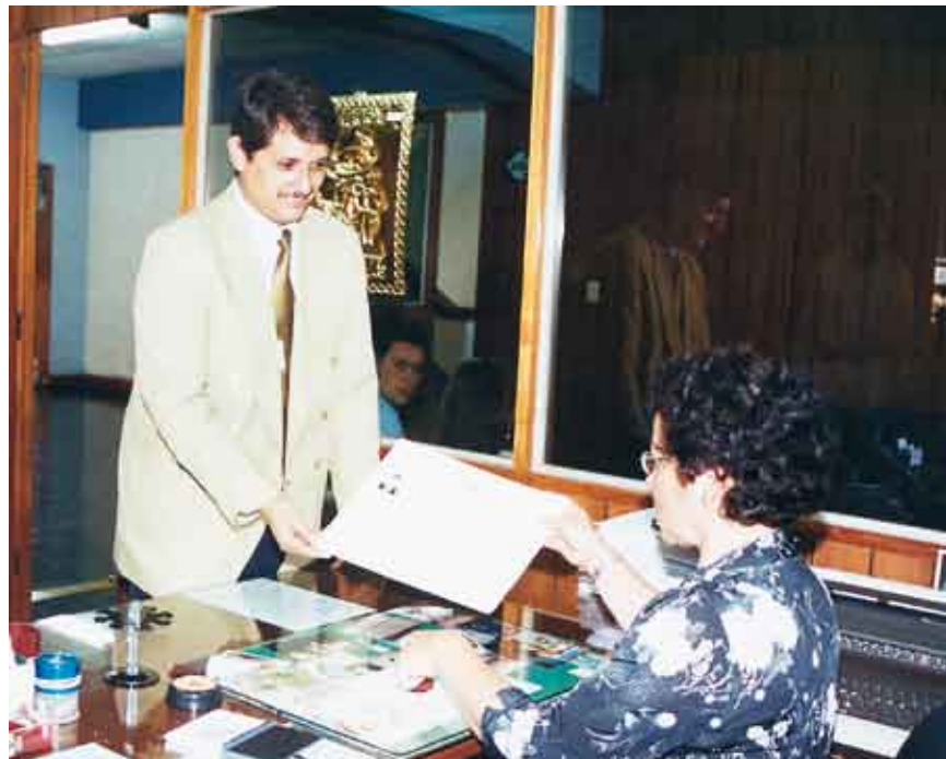
Para mejorar la calidad educativa, los procesos en las universidades deben mejorar.

Es importante tener en cuenta que el reto de las instituciones educativas de nivel superior tiene que ver con la eficaz satisfacción a través de modelos educativos novedosos, de las nuevas demandas que surgen del desarrollo científico tecnológico y del mercado del nivel profesional, en un contexto global de cambios inmediatos.